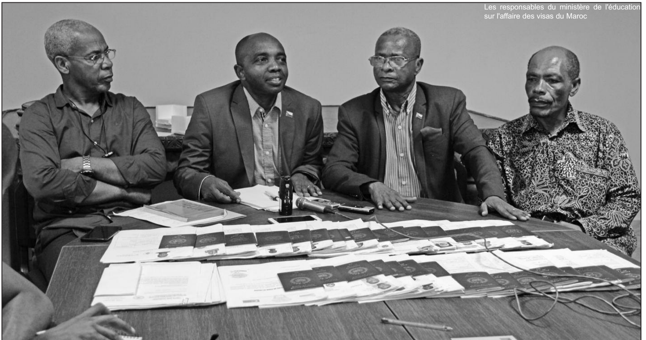
Les responsables du ministère de l'éducation sur l'affaire des visas du Maroc