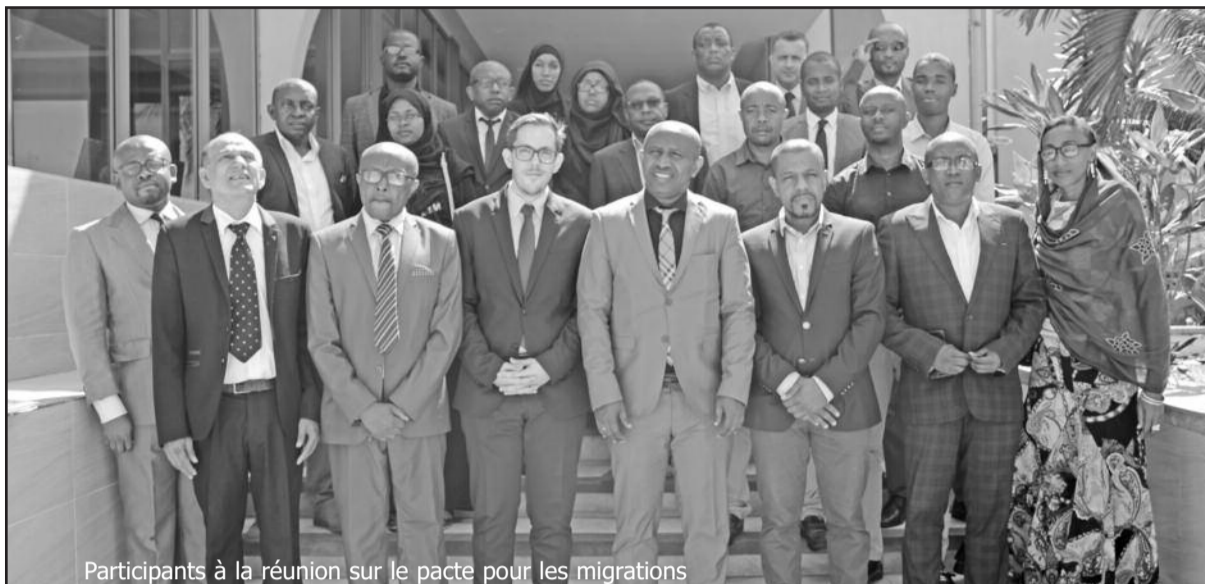
Participants à la réunion sur le pacte pour les migrations

Presque tous les États membres de l'ONU signeront dans le cadre d'une cérémonie officielle qui se tiendra au Maroc en décembre prochain, un accord de l'ONU qui fait de la migration un droit de l'homme. Aux Comores, le ministère des Affaires Étrangères et le ministère de l'Intérieur ont organisé, hier à Moroni, un atelier de consultation sur ce thème, avec l'appui technique et financier de l'Organisation Internationale pour les migrants (OIM) et de l'Union Européenne.